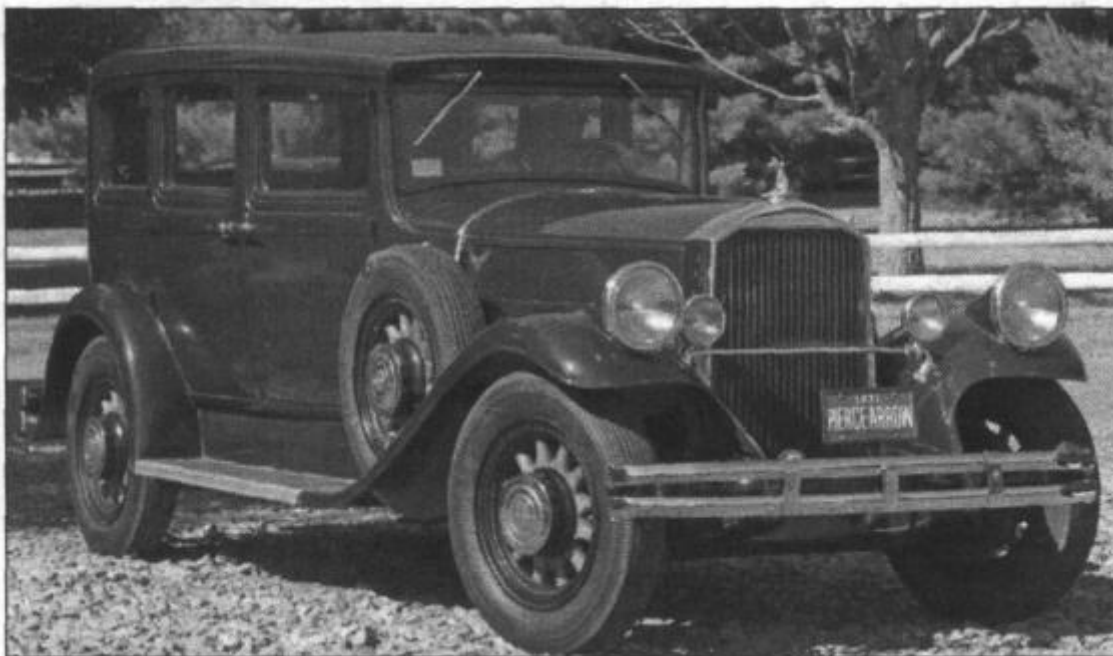
A 1931 Pierce-Arrow Eight sedan, podobný Teslovu elektrickému testovacímu autu.

Tyto vozy si vydobily své místo na trhu a měly propracovaný, často elegantní, uzavřený design.